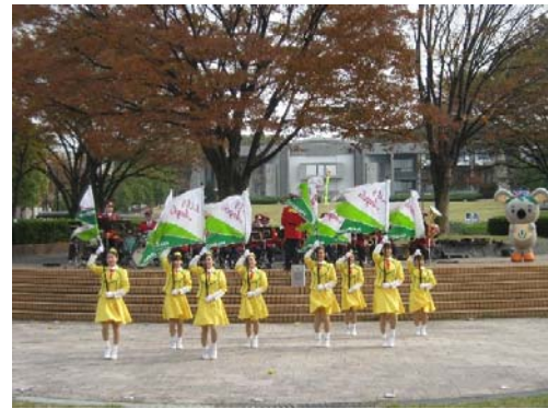
ポッカレモン消防音楽隊（演技）