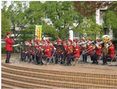
ポッカレモン消防音楽隊（演奏）