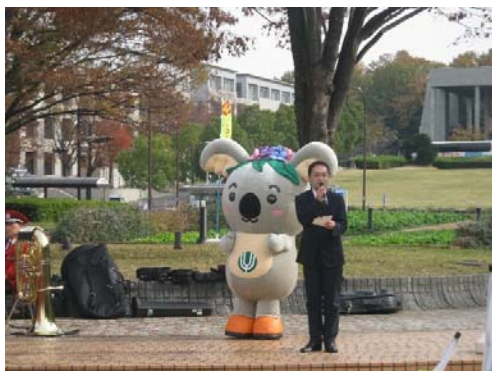
千種区マスコットキャラクター「こあらっち」も参加