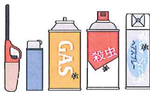
使い捨てライター ガスボンベ、スプレー缶

平成20年度の大江破碎工場での火災事故を踏まえ、平成22年6月発火性危険物の別途収集を開始した。